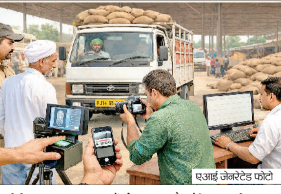
एआई जेनरेटेड फोटो

मंडियों में रबी की फसलों की खरीद-फरोख्त में अब दस दिन भी शेष बचे हैं। जिससे की खरीद को लेकर सरकार ने तमाम तरह की नई व्यवस्था करने का दावा इस बार किया है। मंगलवार को चंडीगढ़ में खरीद से जुड़े विभागों की मीटिंग हुई। इसमें तमाम तरह के निर्देश सरकार ने अफसरों को दिए हैं। मीटिंग में मौजूद अधिकारियों के मुताबिक खरीद प्रक्रिया को अधिक पारदर्शी और व्यवस्थित बनाने के लिए इस बार कई नई व्यवस्थाएं लागू की हैं। अब सवाल ये है कि क्या नई व्यवस्थाएं करनाल धान खरीद घोटाला की पुनरावृत्ति को रोक पाएंगी। या ऐसे ही सिस्टम चलेगा। मालूम रहे कि 28 मार्च से सरसों और एक अप्रैल मंडियों में गेहूं की सरकारी खरीद प्रारंभ होनी है।