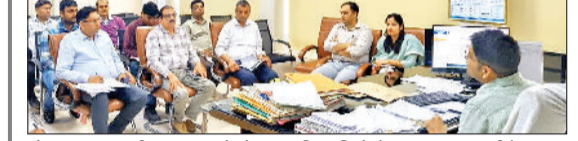
रोहतक। सफाई व्यवस्था को लेकर अधिकारियों के साथ महत्वपूर्ण बैठक करते नगर निगम आयुक्त डा. आनंद कुमार शर्मा।

रोहतक। शहर को स्वच्छ और सुंदर बनाने के लिए नगर निगम ने अपनी तैयारियां तेज कर दी हैं। अब शहर की जनता ही सफाई का फिजिकल देगी की सफाई हुई है या नहीं। स्वच्छ सर्वेक्षण-2025-26 को ध्यान में रखते हुए नगर निगम आयुक्त डा. आनंद कुमार शर्मा ने वार्डों में तैनात अधिकारियों के साथ एक महत्वपूर्ण बैठक कर सफाई व्यवस्था को और सुदृढ़ बनाने के निर्देश दिए। बैठक के दौरान आयुक्त ने सभी अधिकारियों को निर्देशित किया कि वे वार्ड सदस्यों के साथ मिलकर नियमित रूप से सफाई अभियान चलाएं, ताकि जनप्रतिनिधियों की भागीदारी के साथ स्वच्छता कायों को गति मिल सके। उन्होंने कहा कि मुख्य सड़कों, गलियों, बाजारों, सार्वजनिक शौचालयों और पार्कों की सफाई पर