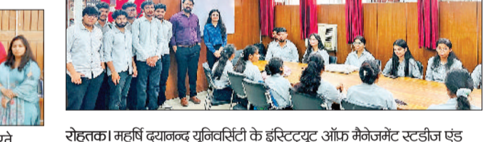
रोहतक। महर्षि दयानंद यूनिवर्सिटी के इस्ट्रिट्यूट ऑफ मैनेजमेंट स्टडीज एंड रिसर्च (इमएसए) तथा करियर काउंसलिंग एंड प्लेसमेंट द्वारा विश्वविद्यालय परिसर में कैंपस प्लेसमेंट ड्राइव का आयोजन किया गया। इस कार्यक्रम में जीवन बीमा क्षेत्र की प्रतिष्ठित कंपनी आईसीआईआई प्रूडेंशियल लाइफ इश्योरन्स ने भाग लेते हुए विद्यार्थियों का चयन करने के लिए परिसर में साक्षात्कार आयोजित किए। कैंपस प्लेसमेंट ड्राइव में चयनित विद्यार्थियों को चार लाख वार्षिक वेतन पैकेज मिलेगा। कंपनी द्वारा विक्रय कार्यकारी पद के लिए चयनित होने वाले विद्यार्थियों को चार लाख रुपये वार्षिक वेतनमान का पैकेज मिलेगा। इस कैंपस प्लेसमेंट कार्यक्रम में इमएसए के 38 विद्यार्थियों ने पंजीकरण करवाया, जिनमें से 20 विद्यार्थियों ने परिसर में आयोजित साक्षात्कार प्रक्रिया में भाग लिया।