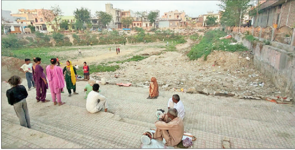
रोहतक। शीतला माता मंदिर के पास बना सरोवर, जिसे सौंदर्यीकरण की जरूरत है।

शहर के ऐतिहासिक और आस्था के प्रमुख केंद्र माता शीतला सरोवर का मुद्दा एक बार फिर चर्चा में है। वर्षों से सौंदर्यीकरण के दावे और योजनाएं बनने के बावजूद सरोवर की हालत जस की तस बनी हुई है। हालात ऐसे हैं कि मंदिर परिसर का यह महत्वपूर्ण सरोवर आज भी अव्यवस्था और उपेक्षा का शिकार नजर आता है। स्थानीय लोगों का कहना है कि यह परियोजना अब केवल कागजों तक सीमित होकर रह गई है। करीब एक दशक पहले हरियाणा के तत्कालीन मुख्यमंत्री मनोहर लाल खट्टर ने माता शीतला सरोवर के सौंदर्यीकरण का एलान किया था। उनके निर्देश पर निगम स्तर पर काम की शुरुआत भी हुई, जिससे लोगों में उम्मीद जगी थी कि इस धार्मिक स्थल का कायाकल्प होगा। लाखों श्रद्धालुओं की आस्था से जुड़े इस स्थान पर बेहतर सुविधाएं विकसित होंगी। लेकिन समय के साथ यह उम्मीदें धुंधली पड़ गईं और काम अधूरा ही रह गया। करीब 500 वर्ष पुराने इस मंदिर और सरोवर का धार्मिक महत्व बेहद गहरा है। मान्यता है कि यहां के जल में स्नान करने से बीमारियां दूर होती हैं। इसके बावजूद सरोवर की स्थिति चिंताजनक बनी हुई है। आसपास अतिक्रमण की समस्या है, कुछ लोगों ने यहां सामान डालकर कब्जा कर लिया है। साथ ही गंदे पानी की निकासी सीधे सरोवर में हो रही है और सफाई का अभाव स्थिति को और बिगाड़ रहा है। अब सवाल यह है कि आखिर कब इस आस्था के केंद्र को उसकी गरिमा के अनुरूप विकसित किया जाएगा।