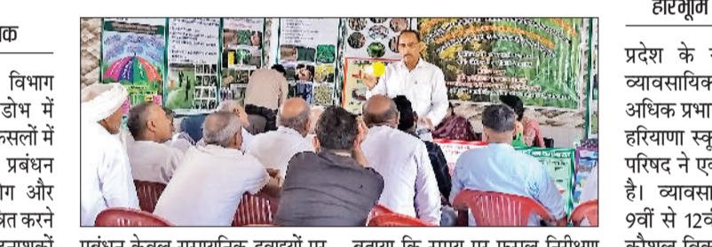
प्रबंधन केवल रासायनिक दवाइयों पर निर्भर होकर नहीं किया जाना चाहिए, बल्कि जैविक, यांत्रिक और सांस्कृतिक उपायों को भी अपनाना जरूरी है।