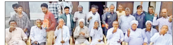
महम। भैणी महाराजपुर गांव की चौपाल में लड्डू बांटकर जीत की खुशी मनाते ग्रामीण।