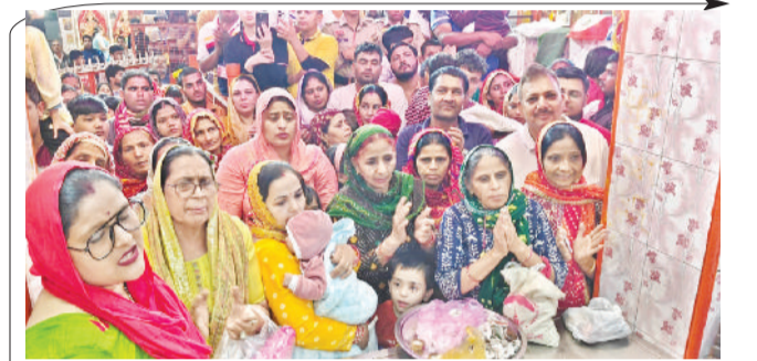
रोहतक के शीतला माता मंदिर में चैत्र के माह में हर बुधवार को बड़ी संख्या में श्रद्धालु मंदिर में दर्शन के लिए पहुंचते हैं और माता की पूजा अर्चना कर मन्तव्य मांगते हैं।

नवरात्रों पर श्रद्धालुओं की उमड़ती है भारी भीड़ शीतला माता सरोवर से लाखों लोगों की आस्था जुड़ी हुई है। मान्यता है कि यहां स्नान करने से बीमारियां दूर होती हैं और माता का आशीर्वाद मिलता है। चैत्र, आसढ़ के चार बुधवार को यहां बड़ा मेला लगता है। देश विदेश से लोग यहां पूजा अर्चना के लिए आते हैं। बच्चों का मुंडन करवाया जाता है। नवरात्रों और अन्य धार्मिक अवसरों पर भी यहां श्रद्धालुओं की भारी भीड़ उमड़ती है।