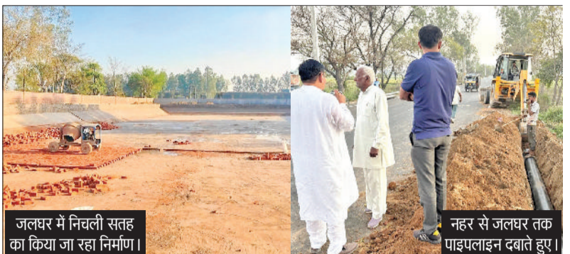
जलघर में निचली सतह का किया जा रहा निर्माण।